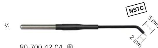
80-700-42-04 10 Aguja para microdissección de tungsteno, 45°