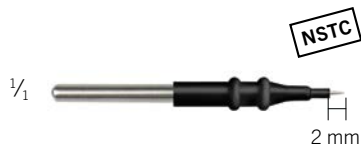
80-700-40-04 10 Aguja para microdissección de tungsteno