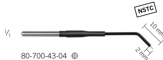
80-700-43-04 10 Aguja para microdissección de tungsteno, 45°