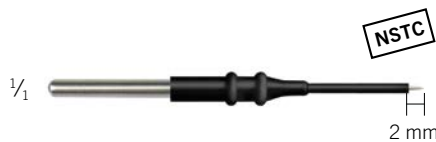
80-700-41-04 10 Aguja para microdissección de tungsteno